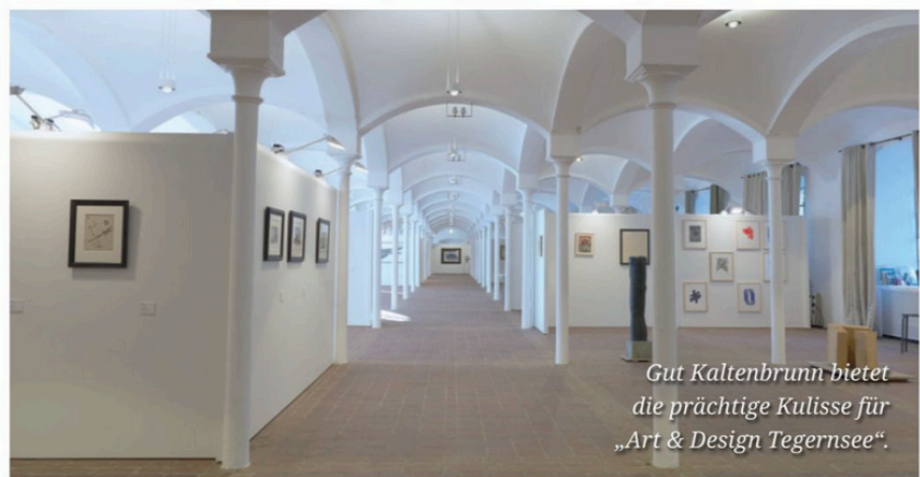
Gut Kaltenbrunn bietet die prächtige Kulisse für „Art & Design Tegernsee“.